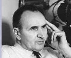
PAĽO BIELIK [1910–1983]